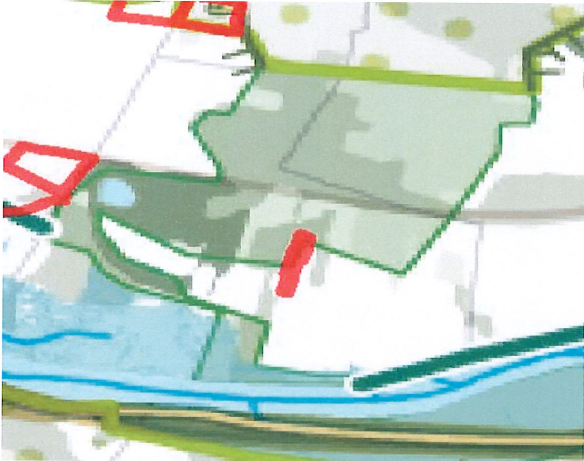
Superposition de la carte du SDRIF-E avec le secteur de la Fontaine Saint Severin correspondant à la zone AU du zonage du PLUI.

La commune souhaite viser une exemplarité sur ce projet, mêlant biodiversité, production d'énergies renouvelables, espaces verts de qualité et insertion végétale dans le site naturel existant.