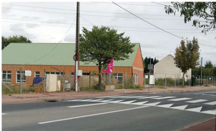
Le nouveau ralentisseur sécurisera l'entrée du futur groupe scolaire

Avant cela, c'est l'entrée du futur groupe scolaire qui était concernée par un nouvel aménagement : un ralentisseur a été installé par GPS&O afin de sécuriser les abords de l'école.